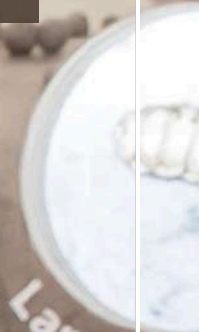
Larwa rębna szara