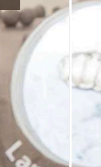
Larwa rębna szara