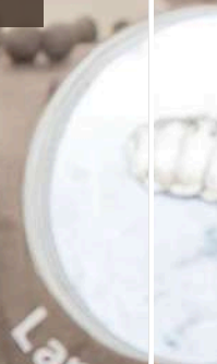
Larwa rejsowa szara